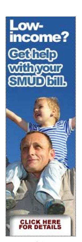
Banner auf der SMUD-Webseite

Ausserdem bietet SMUD "Einspeisevergütungen" (Feed-In-Tariffs) an, um die Stromproduktion in kleinen, privaten Einheiten zu fördern und so den Anteil an regenerativer Energie zu erhöhen. Für dieses Modell erhielt